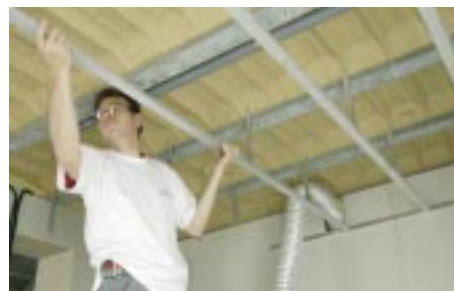
Fixation du rail