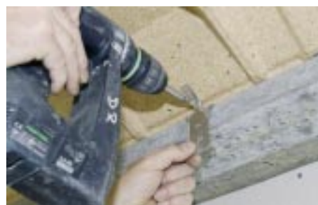
Vissage dans l'entrevous