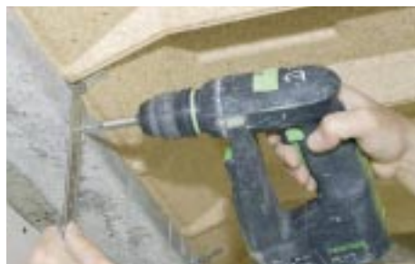
Fixation de la suspente et réglage en hauteur