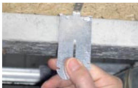
Appui sur la poutrelle

Suspente «PHAR» : griffe spécifique au plancher Rectolight